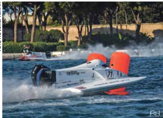
Starptautiskās ātruma laivu sacensības priecēs skatītājus ar aizraujošām cīņām.

LATVIJAS ŪDENS MOTOSPORTA FEDERĀCIJAS informācija