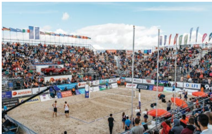
Šobrīd Jūrmalā pieejamas daudzveidīgas sporta iespējas, sporta un aktīvās atpūtas infrastruktūra arvien tiek attīstīta un paplašināta ilgtermiņa skatījumā.

2020. gada vasarā plānots uzsākt Jūrmalas pilsētas Lielupes pamatskolas ēkas Aizputes ielā 1A pārbūvi. 2020./2021. mācību gadā