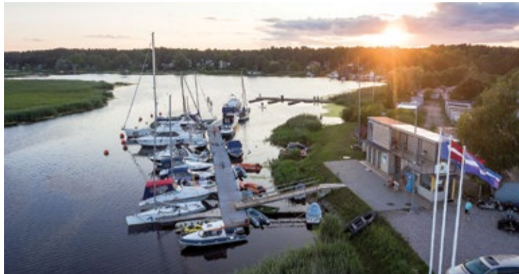
Pieprasījums pēc jahtu ostas pakalpojumiem pērn bija stabils, tādēļ šovasar uzstādīs vēl 18 jaunas tauvošanās laipas, palielinot ostas kapacitāti.

Līdz jūnija sākumam Jūrmalas ostas pārvalde izvietos jahtu ostā "Jūrmala" 18 jaunas tauvošanās laipas, kas palielinās jahtu ostas kapacitāti līdz 80 vietām.