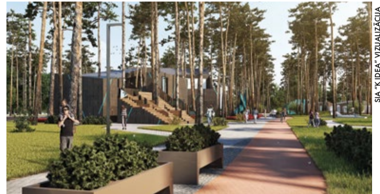
Šovasar plānots sākt Kauguru parka būvniecību. Tas iecerēts kā vieta atpūtai, sporta aktivitātēm un pasākumiem.

Turpinās Jūrmalas Sporta skolas peldbaseinu ēkas pārbūve – siltinātas ēkas norobežojošās konstrukcijas, izbūvēts jauns jumta segums, mainīti logi un durvis, pārbūvētas apkures un ventilācijas sistēmas, izbūvēta jauna elektro-