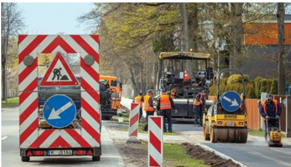
Dubulti prospektā no Gaujas ielas līdz Upes ielai (jūras puse) tiek atjaunots gājēju celiņš.