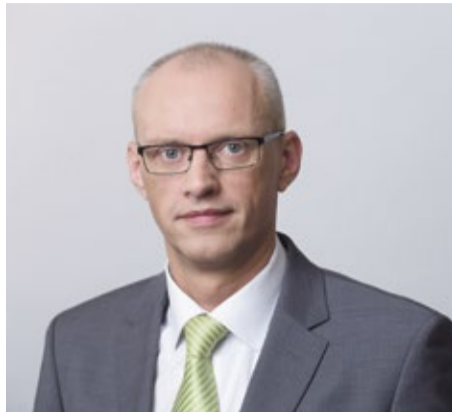
GATIS TRUKSNIS, Jūrmalas pilsētas domes priekšsēdētājs

Neskatoties uz neskaidrību un lielajām pārmaiņām pasaulē un mūsu katra ikdienā, strādājām, domājot par jūrmalnieku dzīves uzlabošanu: pilsētā aktīvi notiek labiekārtošanas darbi. Parkos un skvēros ir sastādītas pavasara puķes, pludmales tiek gatavotas vasaras sezonai, sākti ceļu remontu. Kopumā ceļu remontos šogad plānojam ieguldīt 5,3 miljonus eiro, tostarp turpinām pagājušajā gadā iesāktu daudzdzīvokļu māju iekšpagalmu sakārtošanu.