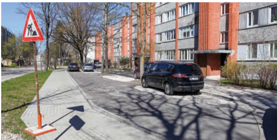
Seguma atjaunošanas darbi uzsākti vienā no Kauguru iekškvartāļiem – Slokas ielā 29.