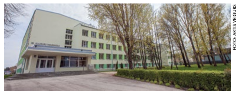
Kauguru vidusskolas ēkas siltināšana ir pabeigta, vasarā turpināsies remontdarbi telpās, lai rudenī skolēni un pedagogi varētu atgriezties savā skolā.

instalācijas sistēma, ierīkots jauns energoefektīvs LED tipa apgaismojums, pārbūvēta ūdensvada un kanalizācijas sistēma. Pašvaldība ir izsludinājusi vairākus iepirkumu konkursus, lai tuvākajā laikā uzsāktu vērienīgus pārbūves darbus vēl divās Jūrmalas pilsētas izglītības iestādēs – šovasar plānots sākt Jūrmalas Valsts ģimnāzijas ēkas pārbūvi un Lielupes pamatskolas ēkas pārbū-