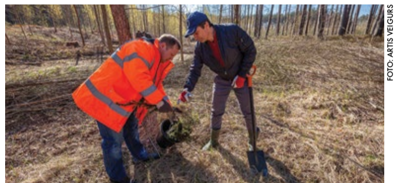
Druvciemā pie Ezeru ielas aprīlī iestādīti 350 eglīšu stādu.

Papildinot kūrortpilsētas mūžzaļo rotu, šogad Jūrmalas pilsētas pašvaldība stāda eglītes.