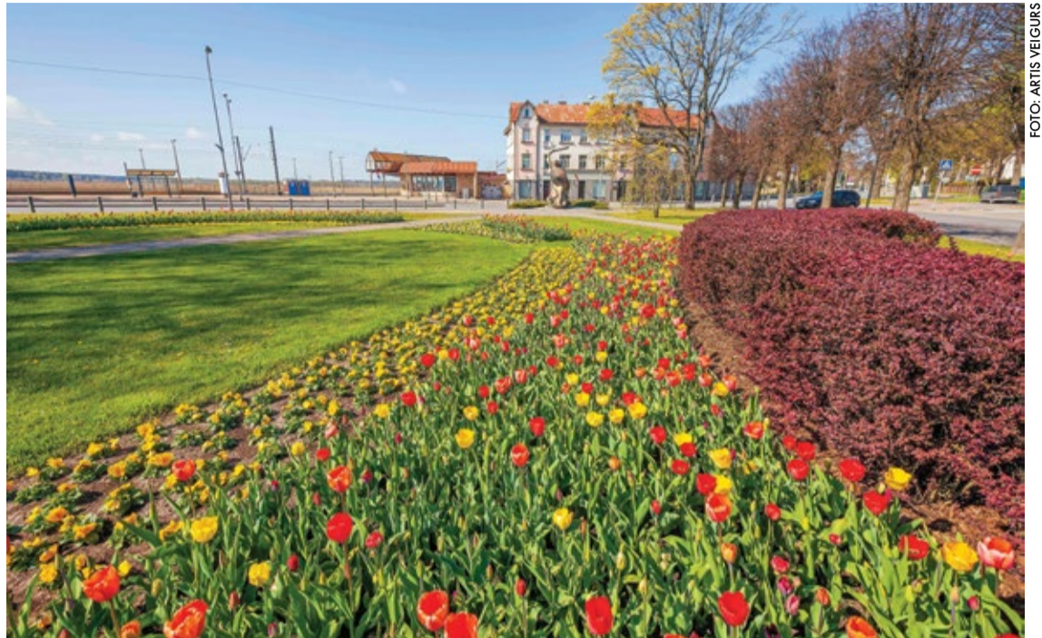
Pilsētas apstādījumos jau krāšņi zied atraitnītes un tulpes.

Košākās un lielākās puķudobes būs Horna dārzā pie Jūrmalas