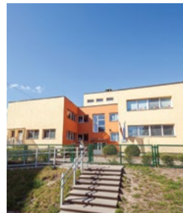
No 1. septembra pirmsskolas izglītības programmu īstenošanu no Jūrmalas pilsētas Lielupes pamatskolas pārņems sākumskola "Ābelīte".

Iecerēts, ka 1.–4. klašu skolēni iepazīs Eiropas valstu kultūras mantojuma vērtības – tautastēpus, nacionālos ēdienus, sporta veidus un mūziku. Realizējot starptautisku projektu, mācību procesā akcentēs kultūras mantojumu, skolēni uzlabos svešvalodu un informācijas tehnoloģijas lietošanas prasmes. Savukārt skolotāji dalīsies ar labās prakses piemēriem: Zviedrijas skola rādīs, kā mācībām izmantot di-